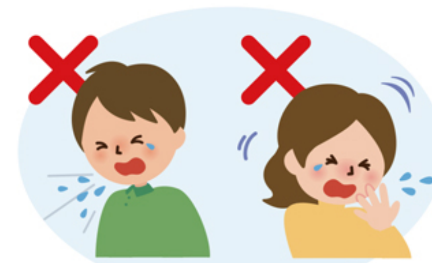
何もせずに 咳やくしゃみをする 咳やくしゃみを 手でおさえる