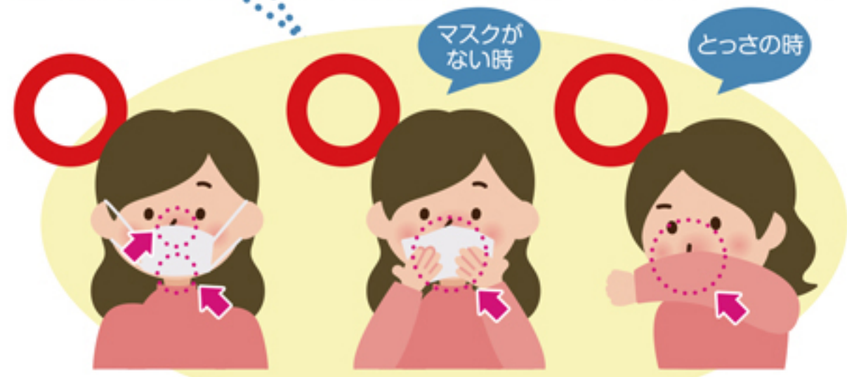
マスクを着用する (口・鼻を覆う) ティッシュ・ハンカチで 口・鼻を覆う とっさの時 袖で口・鼻を覆う