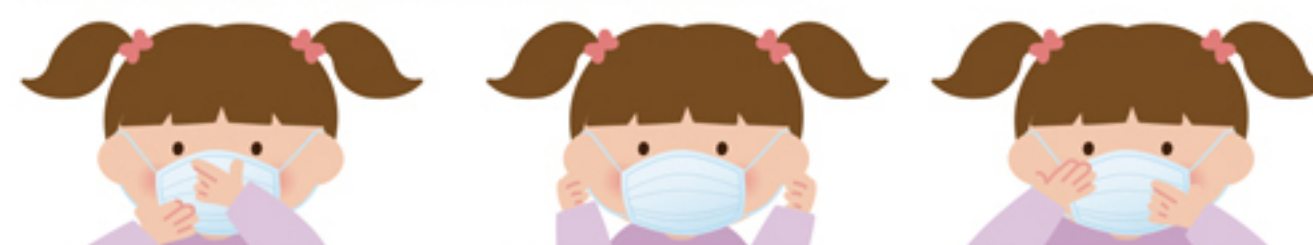
1 鼻と口の両方を 確実に覆う 2 ゴムひもを 耳にかける 3 隙間がないよう 鼻まで覆う