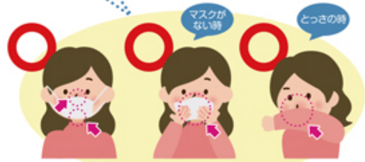
マスクを着用する (口・鼻を覆う) ティッシュ・ハンカチで 口・鼻を覆う とっさの時 袖で口・鼻を覆う