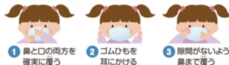
1 鼻と口の両方を 確実に覆う 2 ゴムひもを 耳にかける 3 隙間がないよう 鼻まで覆う